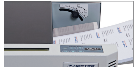
Utilisation facile et réglage individuel de l'épaisseur de papier

(Sous toute réserve de modifications techniques)