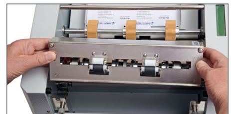
La cassette avec les couteaux se laisse très facilement enlevée et changée pour, par exemple, la remplacer par l'unité de perforation ou bien de rainage