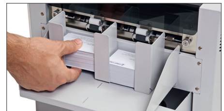
Un plateau de réception ajustable de façon universelle grâce à des aimants