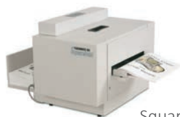
Squarefolder SQF 104