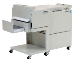
Bookletmaker BM 60 / 61