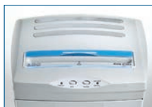
Hohe Blattzuführung durch Zuführbreite von 400 mm