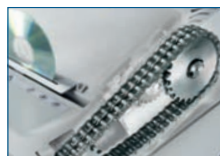
Hochleistungskettenantrieb und Stahlzahnradern