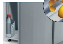
Automatische Ölschmierung der Schneidwellen