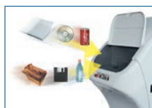
Vernichtung diverser Medien