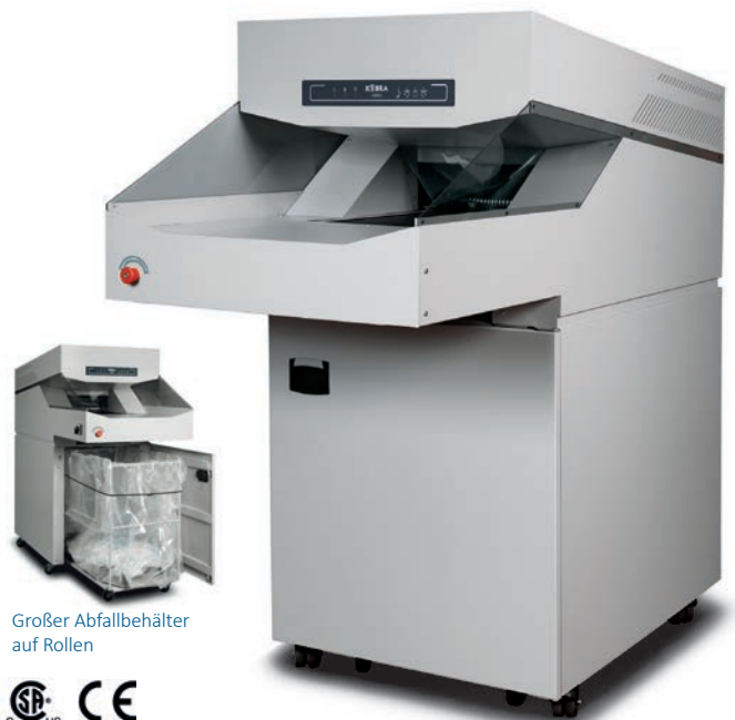
Großer Abfallbehälter auf Rollen