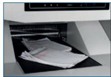
Bequeme und zuverlässige Förderbandzuführung