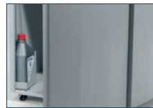
Automatische Ölschmierung der Schneidwellen