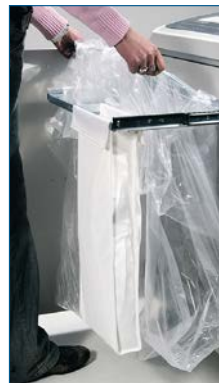
Getrennte Auffangbehälter für Papier und CD's/ Kreditkarten