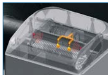
Option: Automatische Ölschmierung der Schneidwellen für alle Modelle mit Partikelschnitt