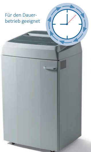
Für den Dauerbetrieb geeignet