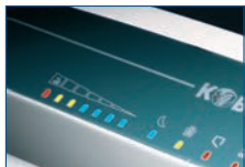
LED-Lastanzeige beim Schreddern