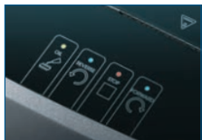
Bedienung über Touch-Board-Tastatur, LED-Leuchtanzeigen für alle Funktionen