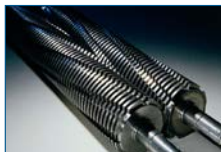
Papierschnidwellen: 5 Jahre Gewährleistung (außer HS5/HS 6 Modelle)