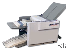
Falzmaschine TF MEGA-A plus