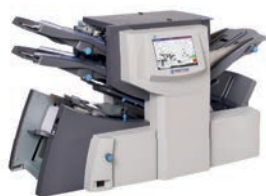
Kuvertiermaschine SI 4350