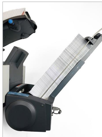
Power Stacker: behält die Druckreihenfolge bei und kann bis zu 800 Kuverts aufnehmen.