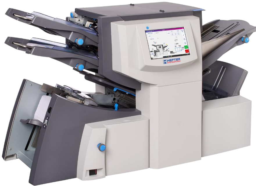
Die neue Kuvertiermaschine SI 4350 von HEFTER Systemform

Prien am Chiemsee - Neuigkeiten aus dem Hause HEFTER Systemform. Die bewährten Kuvertiermaschinen der Serie 3000 (SI 3350, SI 3550 und SI 3700) werden von der Generation der Serie 4000 (SI 4250 & SI 4350) ersetzt. Das heißt: Gutes wird jetzt noch besser und vor allem zeitgemäßer dank Touchscreen und intuitiver Menüführung. Aber werfen wir doch einmal einen genaueren Blick auf die neuen Tischkuvertier-Highlights SI 4250 und SI 4350 aus Oberbayern und was sie Neues bieten.