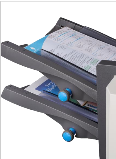
Zwei automatische Zuführstationen für jeweils 325 Blatt

Neben Neuem, das den Arbeitsalltag sinnvoll verbessert, setzt die neue Serie 4000 die Erfolgsgeschichte der Vorgängerserie mit bewährter und robuster Technik fort. Kein Wunder, kommt doch bei beiden Maschinen das Optimum aus jahrzehntelanger Erfahrung zusammen. Unter dem Motto Benutzerfreundlichkeit trifft Produktivität ist jetzt das Zusammenstellen, Falzen und Kuvertieren von Postsendungen so einfach, schnell und sicher wie noch nie.