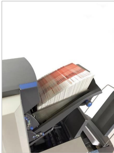
Große Beilagenstation (30 cm Anlagekapazität)