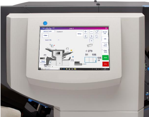
Neuer großer Touchscreen mit intuitiver Bedienung