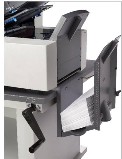
Standardablage für Kuverts