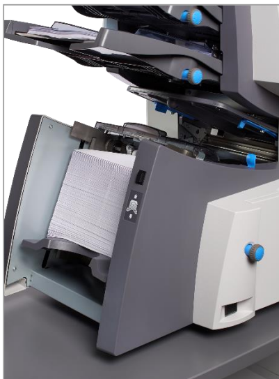
Kuvertlift mit einer Kapazität von bis zu 300 Kuverts (bei SI 4350).

Apropos praktisch. Zwei automatische Zuführstationen mit bis zu 325 Blatt, eine gerade Zuführung von maximal 300 DIN lang bis C5-Kuverts, eine Beilagenzuführung für bis zu 2 mm dicke Beilagen und ein optionaler Power Stacker für bis zu 800 Kuverts (je nach Befüllung) machen die tägliche Arbeit einfach einfacher - und effizienter.