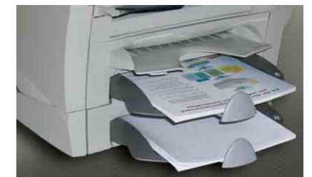
Zuführschacht für DIN A4 Formulare und Tagespoststation (zweiter A4-Schacht optional)