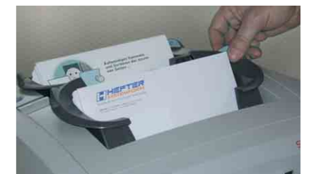
Kuvertzuführung und Beilagenstation