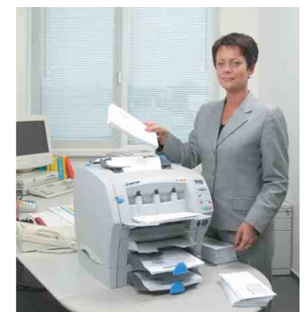
Der effiziente Helfer für Ihren Postausgang