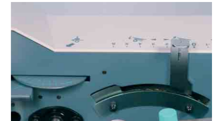
Justagemöglichkeiten für den Blattanpressdruck und für die Blattseparierung