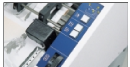
Bedientableau V 5000