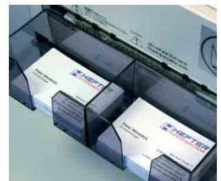
Saubere Ablage der Kartenstapel