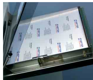
Zuführstation für bis zu 40 Bögen