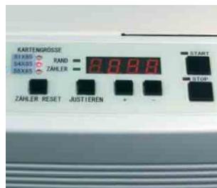
Übersichtliches Bedientableau mit Kartenzähler

Die CC 334 ist ideal für den Einsatz z.B. in Hausdruckereien, Copy Shops, Marketing-Abteilungen oder bei Druckdienstleistern.